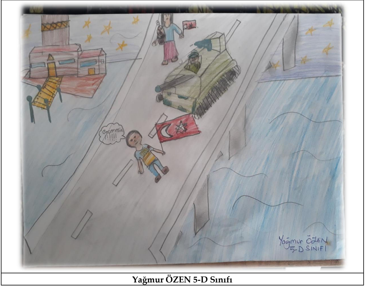
Yağmur ÖZEN 5-D Sınıfı